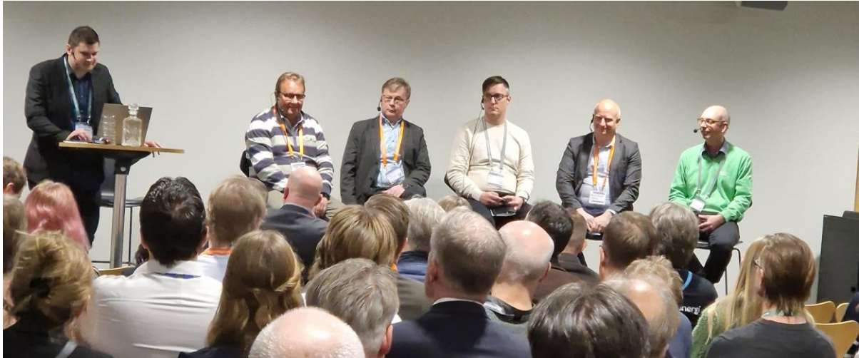
Gemensamt panelsamtal med Energi- och Industridagarna under Matarvattenkonferensen dag 1 2023.

I samband med konferensen skickades en utvärdering ut till alla deltagare. Har du inte redan fyllt i utvärderingen för konferensen får du jättegärna göra det. Länk till utvärderingen finns i mailet "Dela med dig av dina åsikter om Energi- och Industridagarna 2023!" som skickades ut till samtliga deltagare via InvitePeople 2023-11-21. Vi är tacksamma för alla svar, det gör det enklare för oss att förbättra konferensen och organisationen runt den.